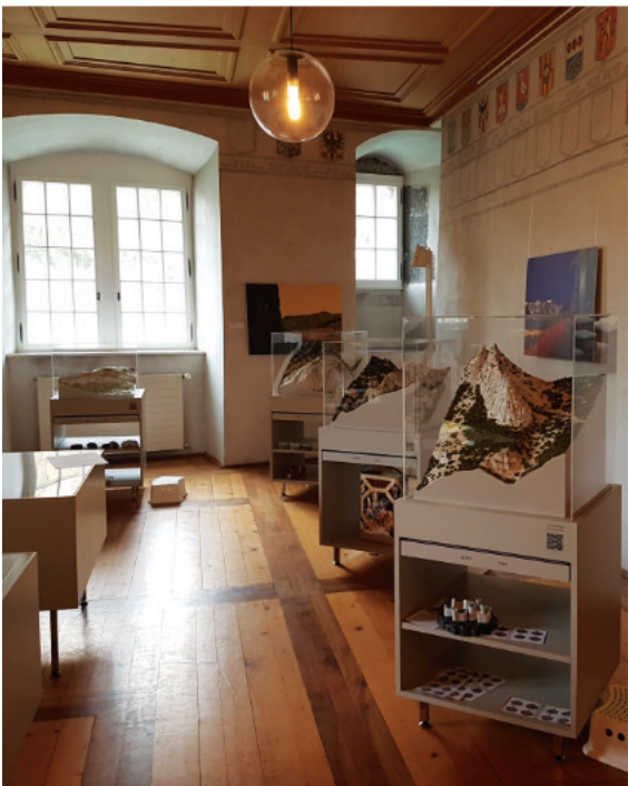
L'exposition trouvait un décor bien différent au Château de Saint-Maurice, mais les maquettes s'adaptent à merveille.

Le projet d'exposition itinérante Là-haut/da oben, sites fortifiés du Valais de la Préhistoire à nos jours a été présenté au public le 1er juillet 2021 à Naters, au World Nature Forum , puis le 11 septembre 2021 au Château de St-Maurice . En complément des expositions présentées dans ces institutions, près de 2000 personnes l'ont visitées, et quatre visites commentées réunissant en tout 100 personnes ont été conduites.