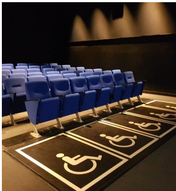
Salle de cinéma du site de la reconstruction de la Grotte Chauvet, Ardèche, France.

Le projet visant à réaliser l'accessibilité universelle à des sites culturels dans la nature nommé Sites et parcs archéologiques pour le plus grand nombre démarrera au début de l'année 2022. ArchaeoTourism soutient ce projet en participant à la recherche de fonds. Il va de soi que les sites archéologiques déjà présents dans le projet du Site of the month seront sollicités à y participer. Ce projet a gagné une reconnaissance internationale. En effet, elle a porté à la création d'un groupe de travail international au sein d'ICOMOS/ICAHM pour la mise en place de lignes directrices pour le patrimoine mondial. Ce groupe de travail organisera un colloque sur le thème de l'accessibilité universelle à Xanten (Allemagne) au mois d'août 2022.