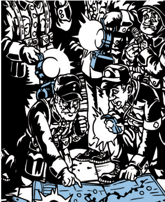
Des soldats égarés dans le fort de Naters, ainsi que les voit Guillaume Mayor pour les besoins de l'exposition