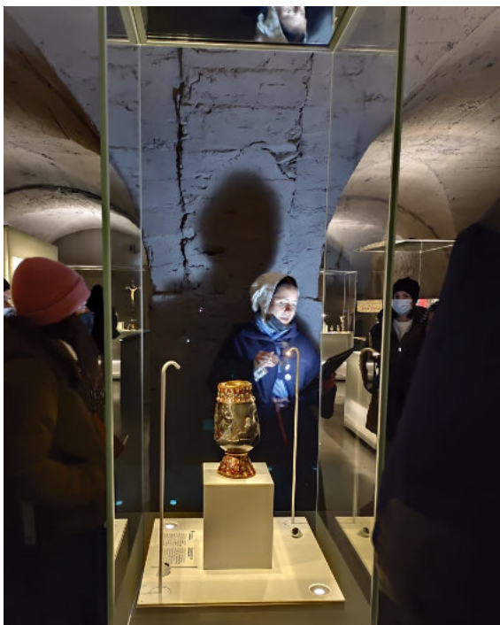
Visite "Noirceurs médiévales" à l'Abbaye de Saint-Maurice, à l'occasion du parcours thématique archéologie pour la Nuit des Musées 2021.