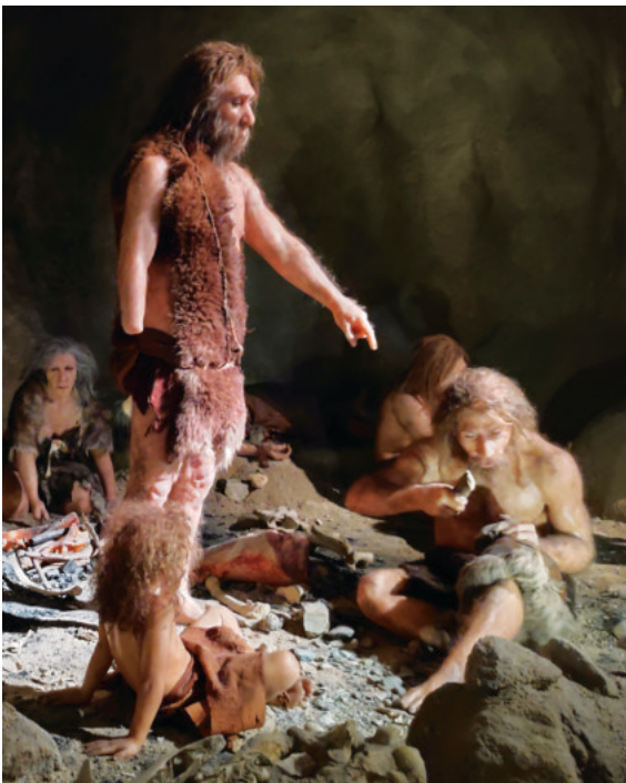
Au Musée de Krapina, un diorama nous montre une scène du quotidien, il y a plusieurs dizaines de milliers d'années