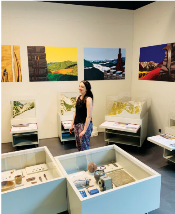
Après une journée de montage au World Nature Forum de Naters