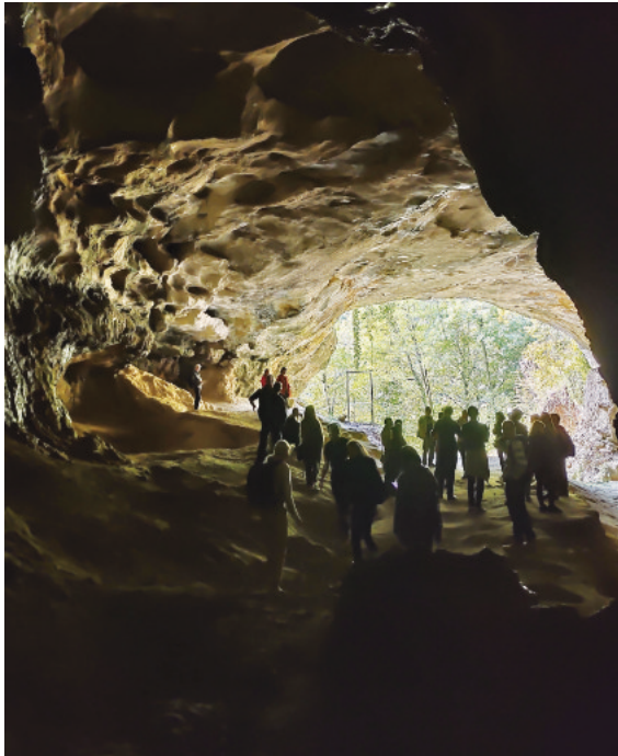
La grotte de Krapina en Croatie, découverte en 1937. Ambiance néandertalienne et course d'école