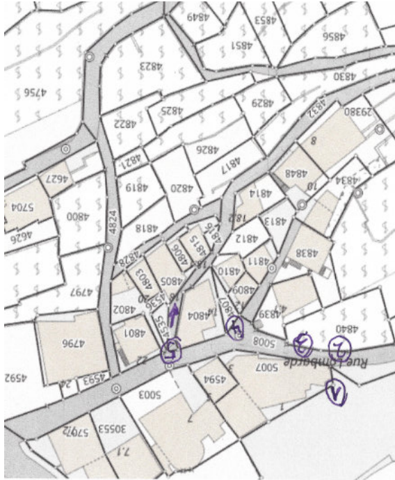
Les premiers contours du sentier didactique qui prendra place dans le vieux bourg de Conthey

En 2022, l'association ArchaeoTourism a été mandaté pour réaliser un sentier didactique dans le vieux bourg de Conthey (Valais) ainsi qu'un dossier pédagogique pour les classes. L'Association des amis du patrimoine contheysan a fourni un riche matériel qu'il va falloir adapter pour le grand public. Pour cela, une nouvelle stratégie touristique va être proposée à la commune et à l'office du tourisme des Coteaux du Soleil.