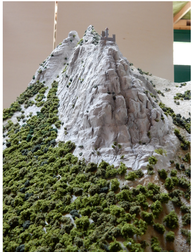
La maquette du château de Beauregard en cours de réalisation

l'accueillir de mai 2021 à novembre 2022: le World Nature Forum de Naters, le Château de Saint-Maurice, le Château de Loèche et le centre culturel des Arsenaux à Sion.